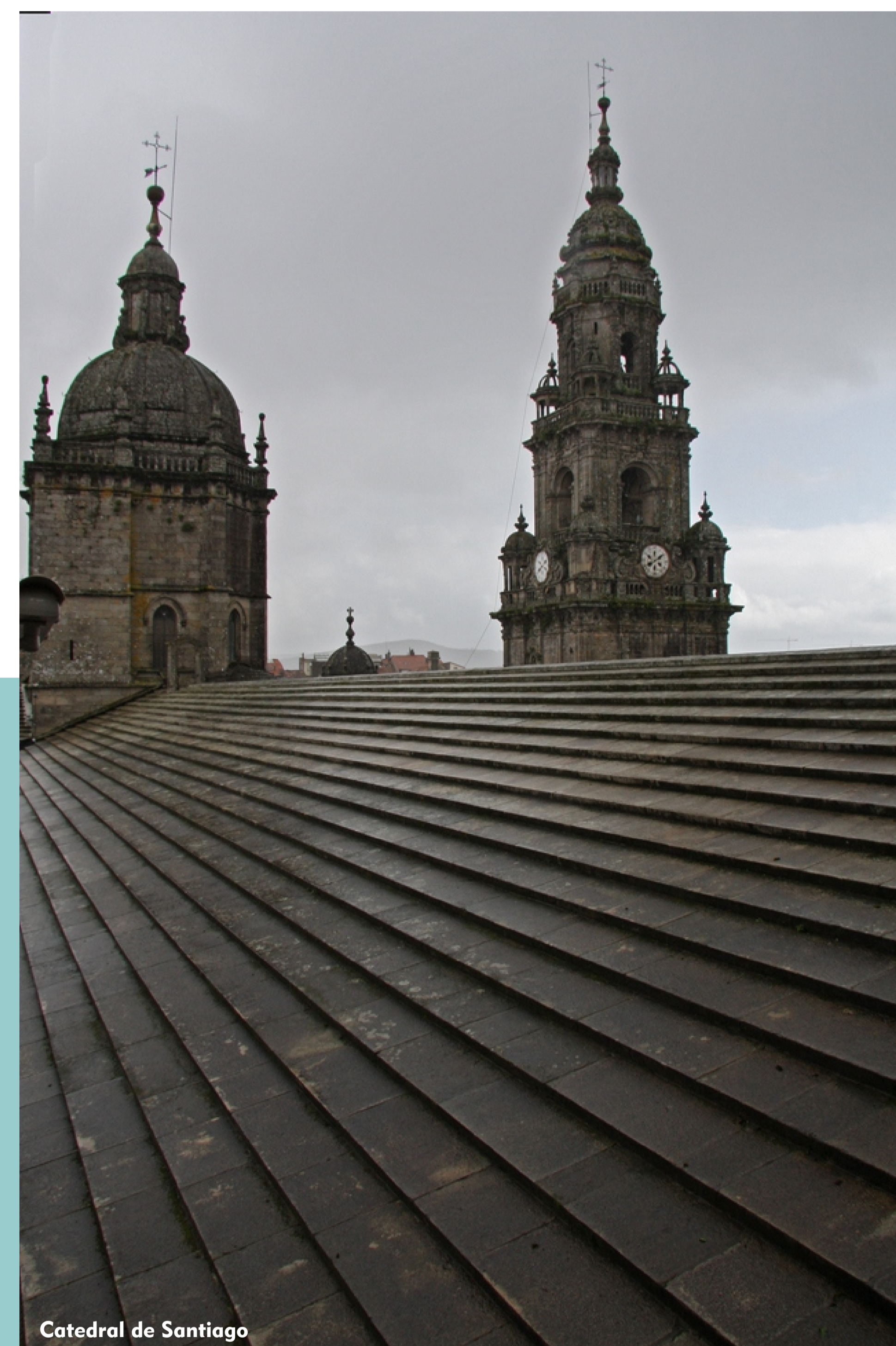
Catedral de Santiago