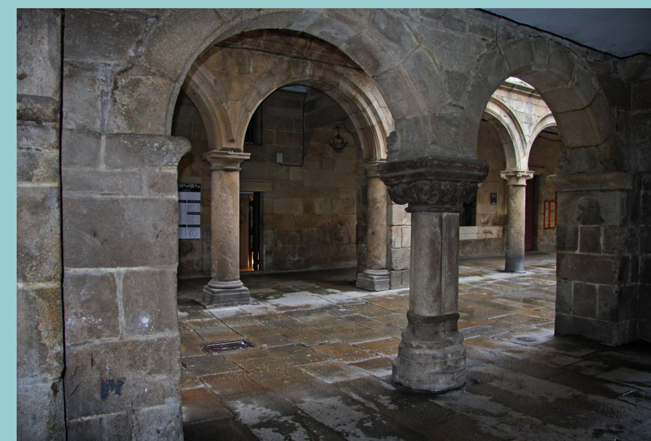
Soportais en Santiaio

Para dar saída á auga de tellados e cubertas constrúense canos, gárgolas e baixantes.