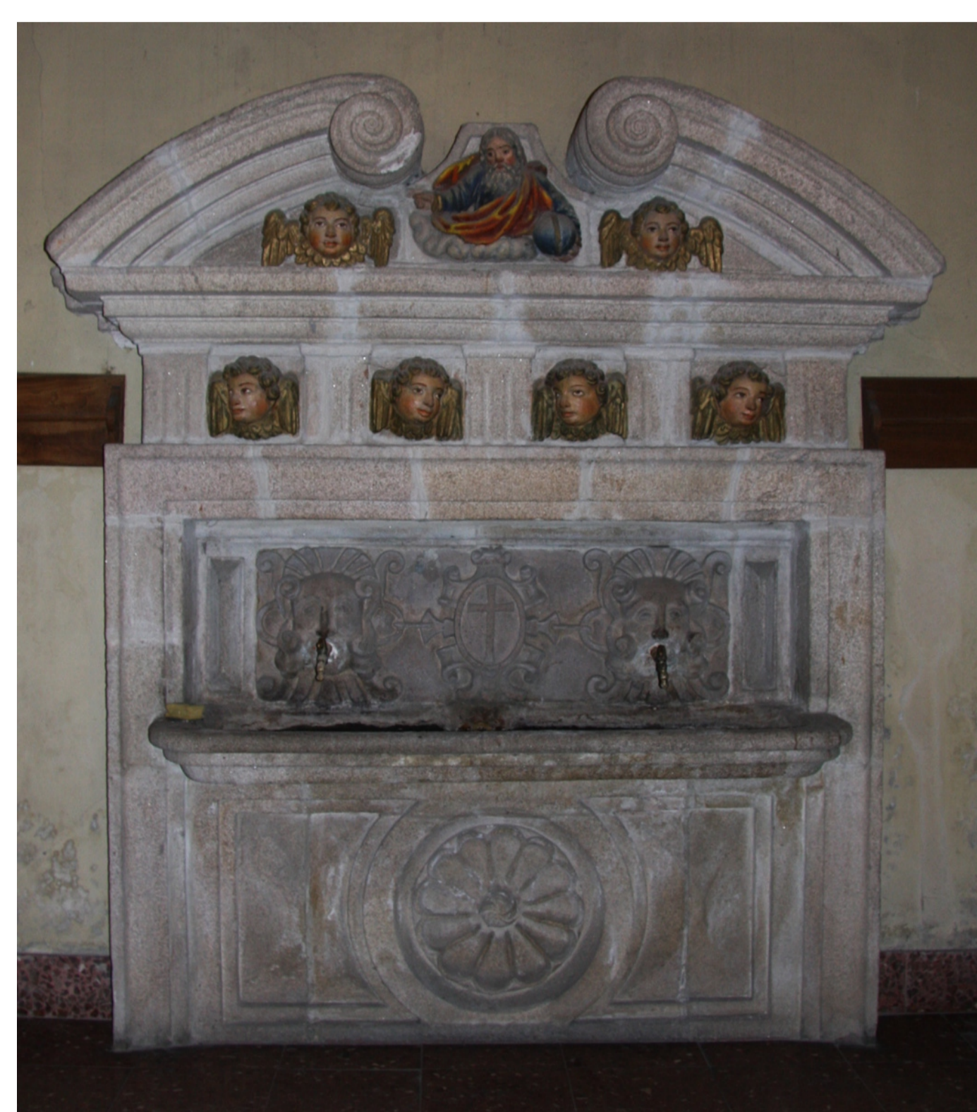
Mosteiro de Samos